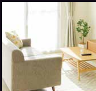
リビングを落ち着いた雰囲気にも…