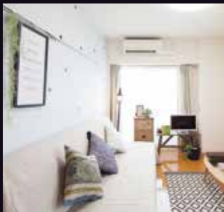
お部屋の間接照明に...