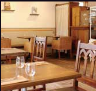
室内の空間演出に...