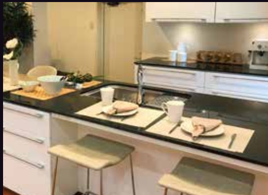
彩り豊かなダイニングカウンターに…