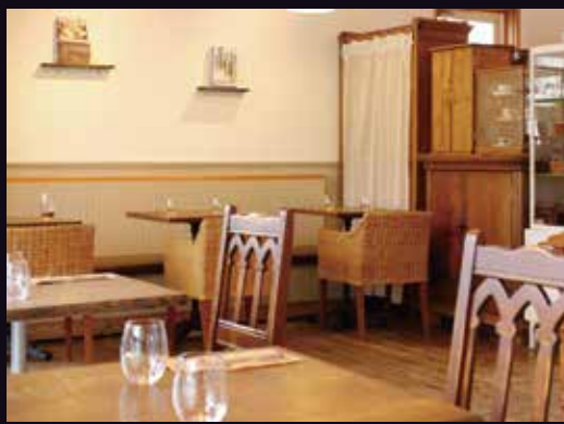
室内の空間演出に...