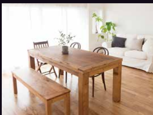
リビングを落ち着いた雰囲気...