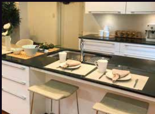
彩り豊かなダイニングカウンターに...