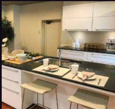
彩り豊かなダイニングカウンターに...