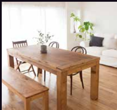
リビングを落ち着いた雰囲気...