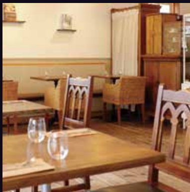
店舗の雰囲気作りに...