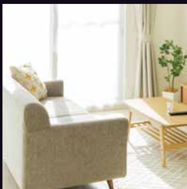
リビングを落ち着いた雰囲気...