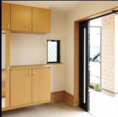
玄関をモダンなイメージに...